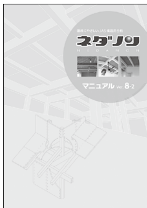
ネダノンマニュアル