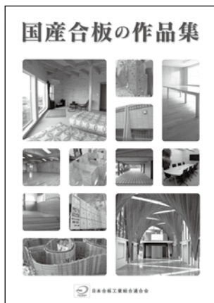
国産合板の作品集