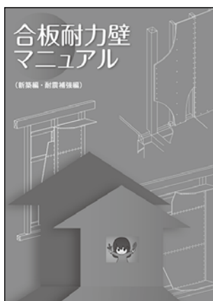
合板耐力壁マニュアル