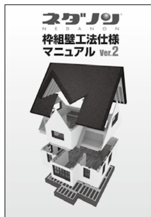
ネダノン枠組壁工法仕様マニュアル