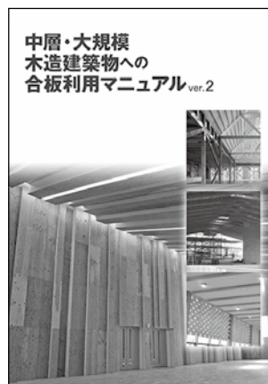
中層・大規模木造建築物への合板利用マニュアル