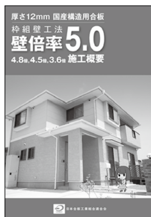
厚さ12mm国産構造用合板耐力壁 枠組壁工法仕様 施工概要