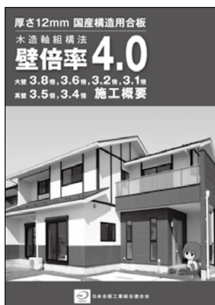
厚さ12mm国産構造用合板耐力壁 木造軸組構法仕様 施工概要