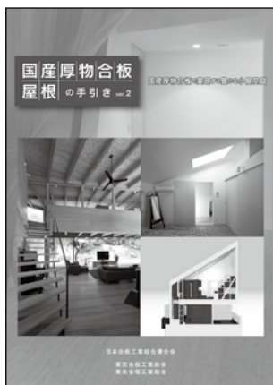
国産厚物合板屋根の手引き